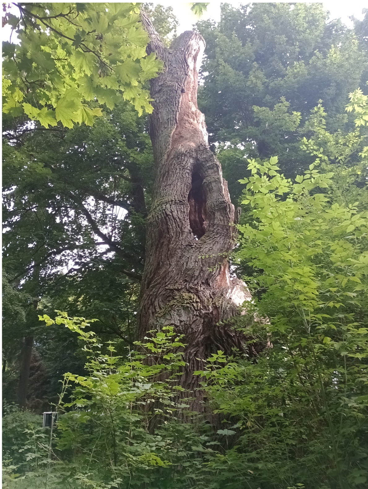
Dąb szypułkowy - Quercus robur rosnący na działce nr ewid. 281/3, obręb geodezyjny Dąbrówka, gm. Sieradz