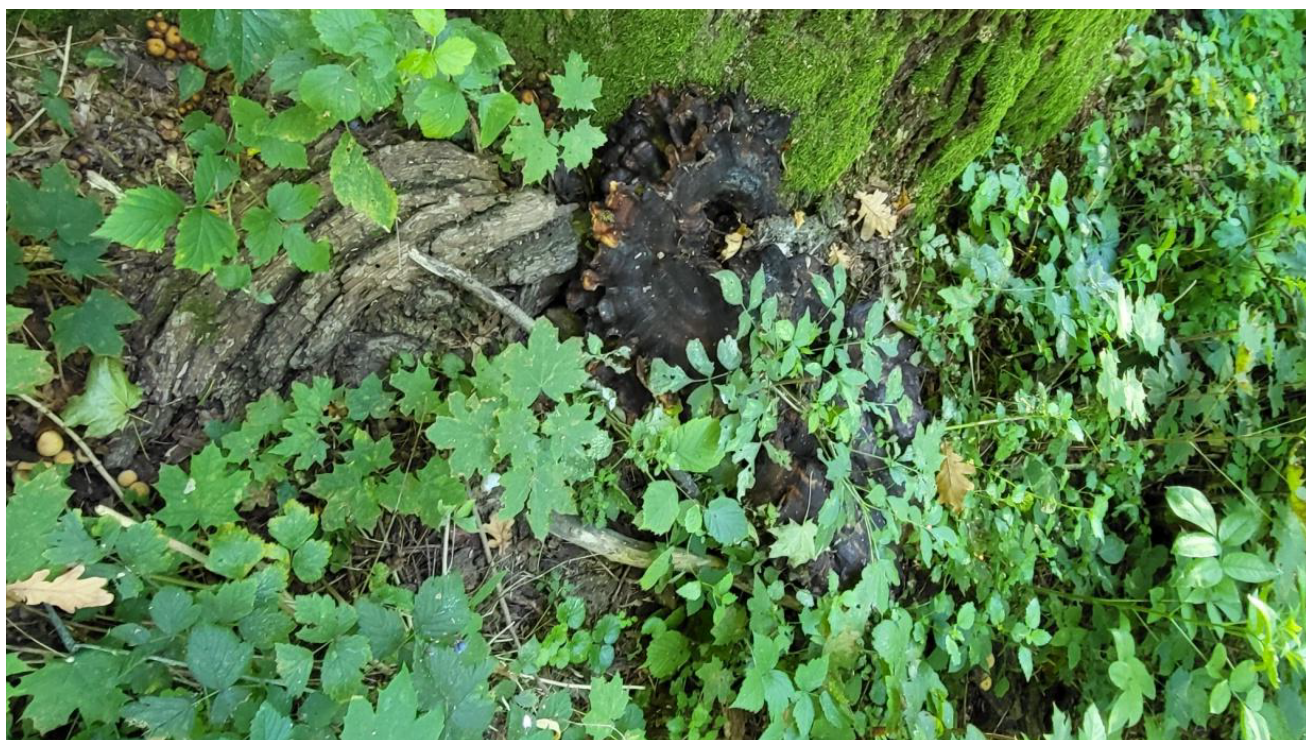
Widok odziomkowej części pnia dębu szypułkowego - Quercus robur rosnącego na działce nr ewid. 281/3, obręb geodezyjny Dąbrówka, gm. Sieradz