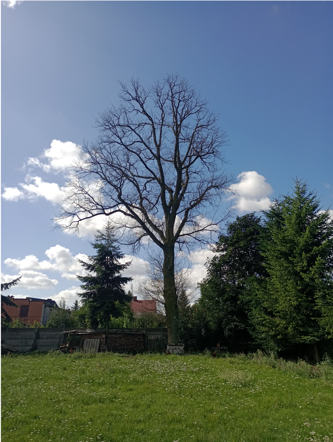
Dąb szypułkowy - Quercus robur rosnący na działce nr ewid. 1303, obręb geodezyjny Męcka Wola, gm. Sieradz