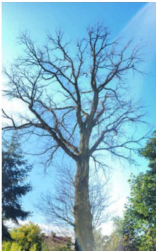
Dąb szypułkowy - Quercus robur rosnący na działce nr ewid. 1303, obręb geodezyjny Męcka Wola, gm. Sieradz