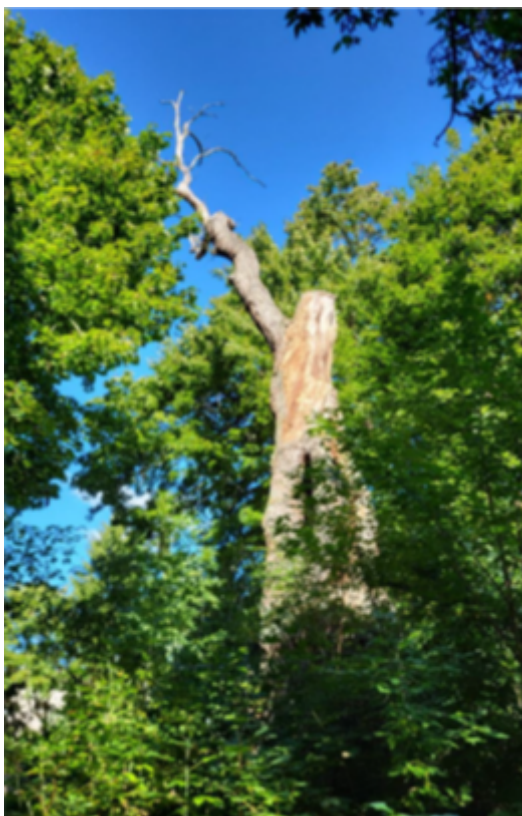
Dąb szypułkowy - Quercus robur rosnący na działce nr ewid. 281/3, obręb geodezyjny Dąbrówka, gm. Sieradz